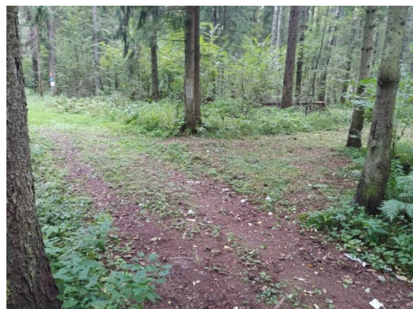
Повороты с лыжной трассы на более мелкие срезки